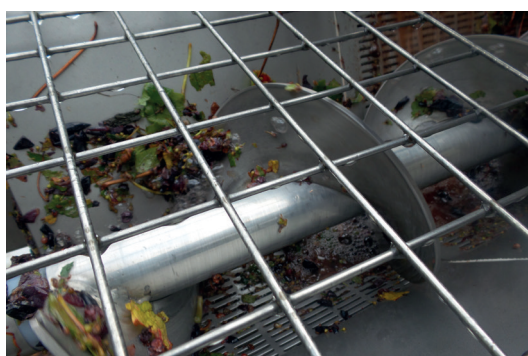
Vis d'évacuation des déchets