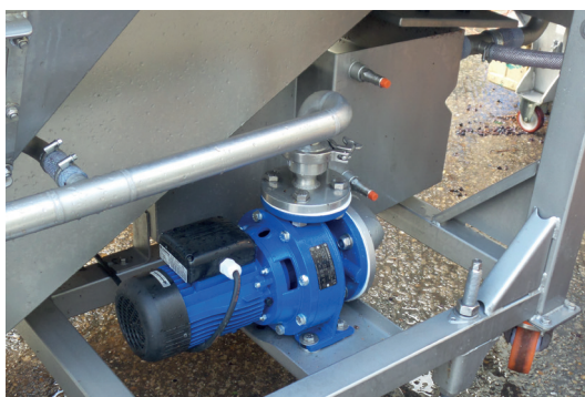
Pompe de circulation