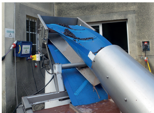
Tapis de convoyage égoutteur breveté